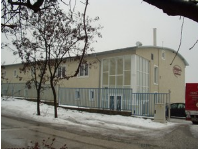
Benennung: Squash Sporthalle Auftraggeber : Squash Berek GmbH. Baumethode: Eisenbeton und Ziegel Ort: Tatabánya Baujahr: 2001