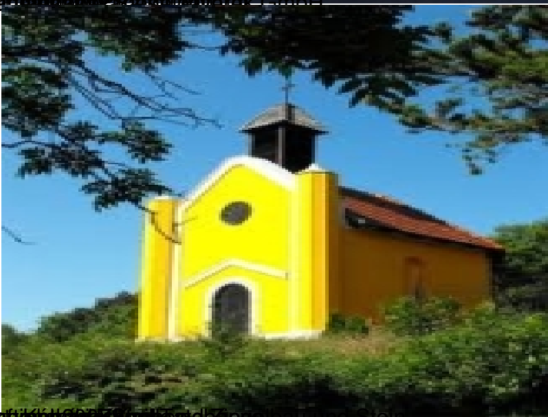
Beauftragter: Kirchenbau und Stein