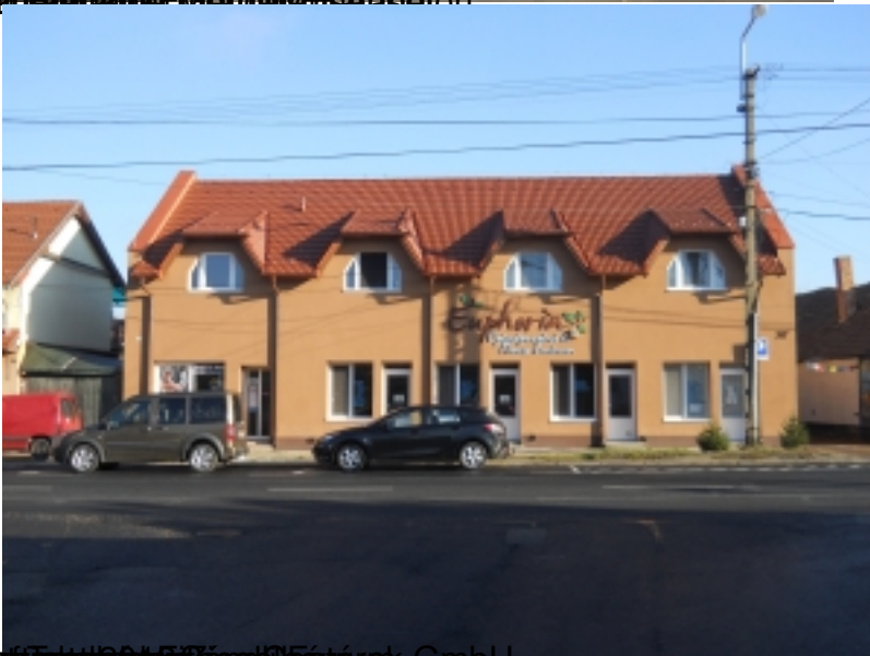
Beauftragter: Euphorie GmbH