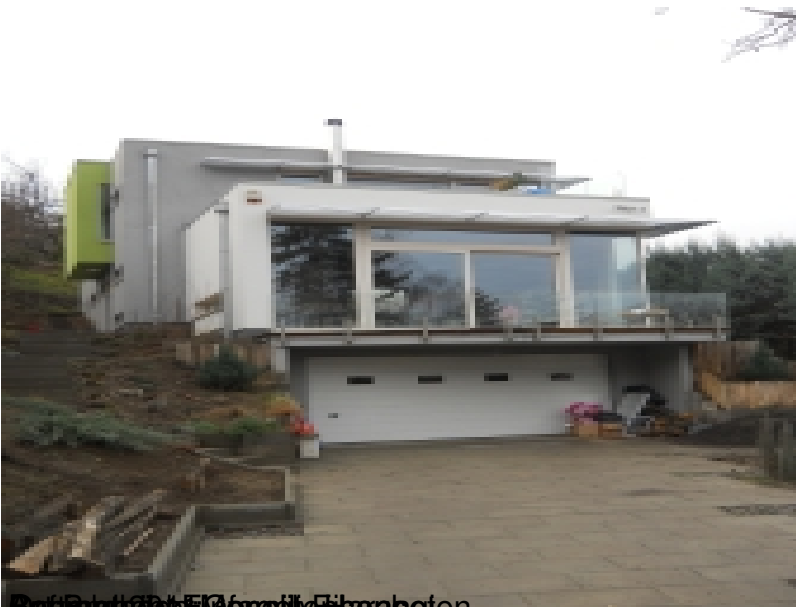
Beauftragter: F&G Immobilien