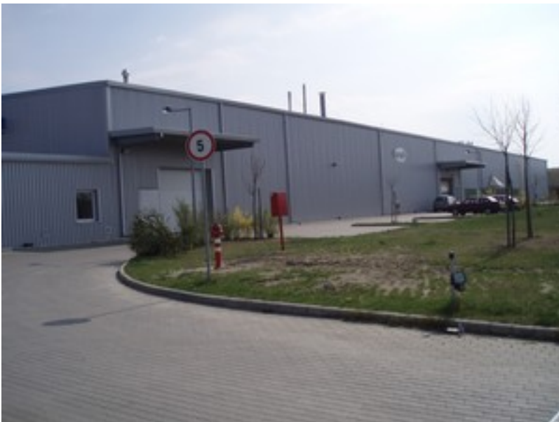
Benennung: Impreglon Auftraggeber : Impreglon GmbH. Baumethode: Eisenwerk bzw. traditioneller Ziegelbau Ort: Tatabánya